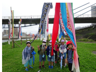
なかよし こいのぼり見学