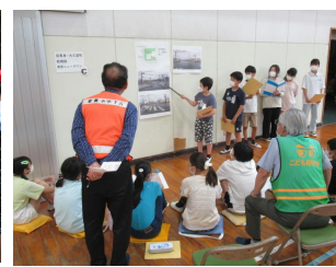
6年 交通安全リーダーと語る会