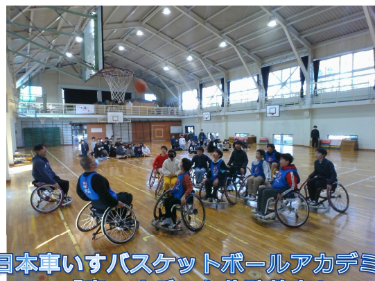
日本車いすバスケットボールアカデミー 「車いすバスケット体験教室」