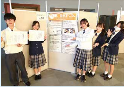
探究（求道）高校1年生 大福班「郷土愛包みました」