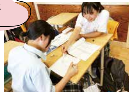
シニアティーチャー(高校生による中等部への学習支援)