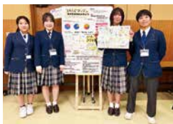
地域探究 高校1年生「まちもぐ探究隊」(伊豆半島探究学習サミット参加)