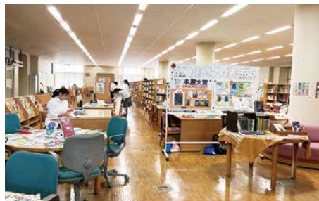
オープンスペースの図書館