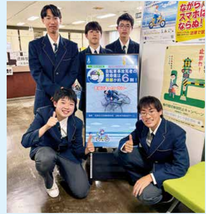
沼津警察署長から感謝状をいただきました