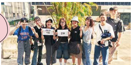
シンガポール修学旅行(現地の大学生と交流)