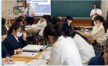
クロスカリキュラム