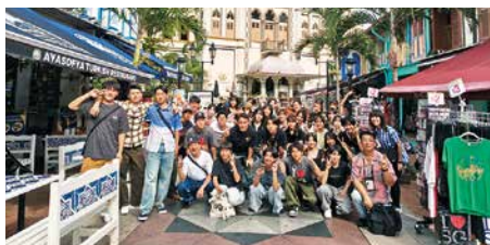
(アラブストリート)