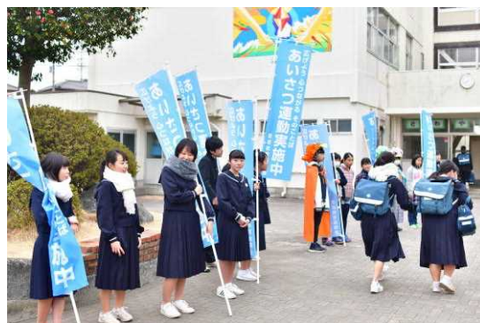
小中合同あいさつ運動

皆さんで良い小学校生活と卒業式を作り上げて、愛鷹中学校に入学してきてください。楽しみにしています。