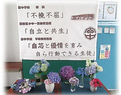
生徒玄関前の紫陽花

大きな節目を乗り越え、一回り大きくたくましく成長した原中生たち。行事で得た自信と「共生」の精神を、これからの日常の学びや部活動へとつなげ、さらに自らの「色」を深く輝かせてほしいと願っています。保護者の皆様、引き続き、御支援のほどよろしくお願いいたします。